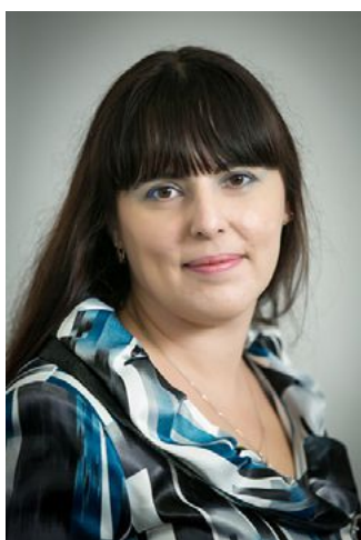
Ответственный редактор Ольга Воробейчикова