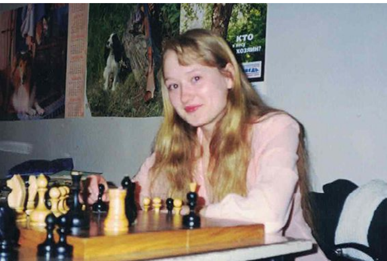
Это был последний шанс шахмат