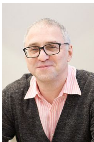
Безответственный главред Евгений Сно