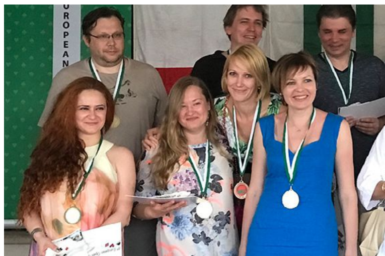
Чемпионы Европы 2017 года