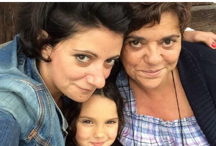
Трое из ларца...