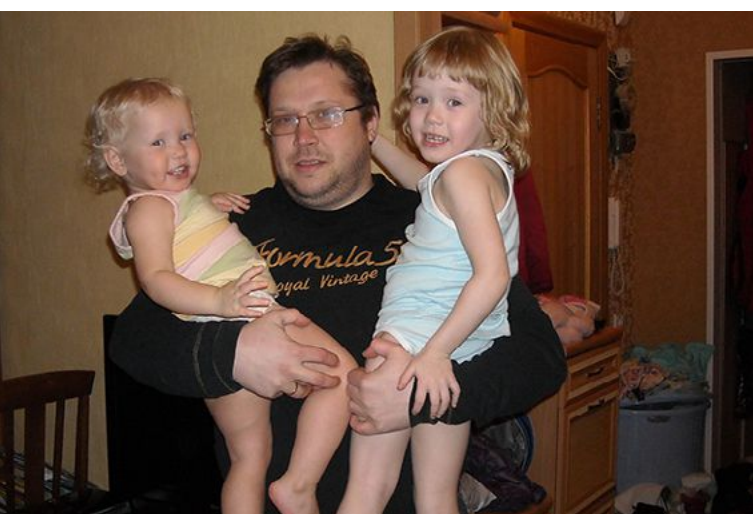
Рудакошка – картошка и Рудаковка – морковка