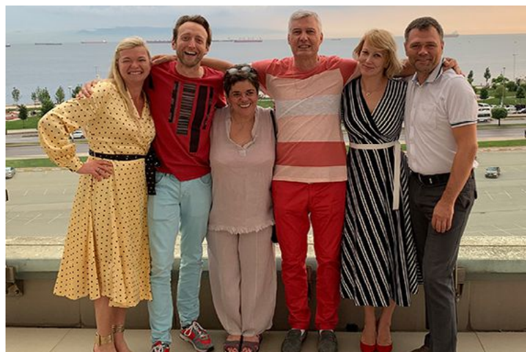
Победа в Стамбуле в 2019 году