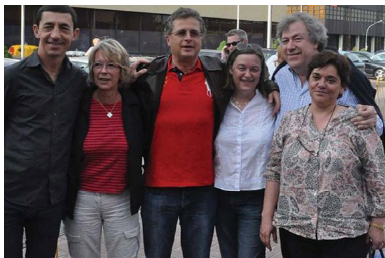
Победа в Познани в 2011 году