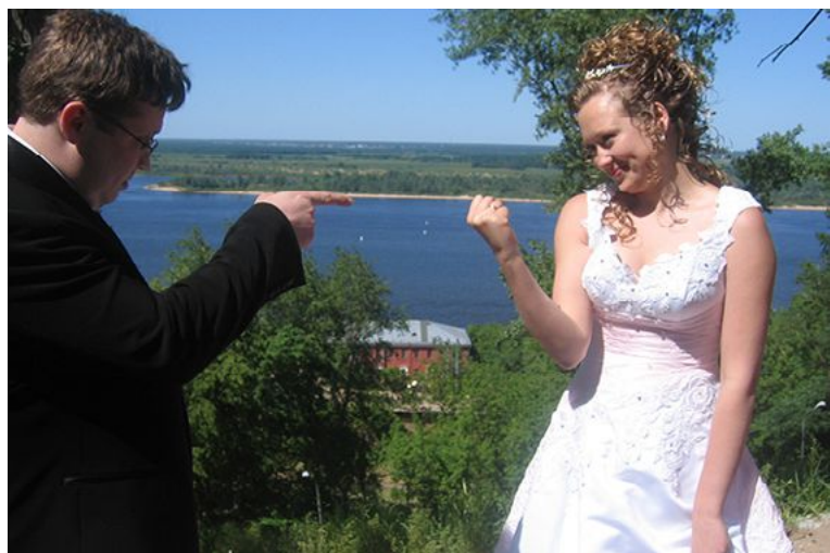
Смотри у меня! Сам смотри!

Женя: Я оцениваю свой «автомат» процентов на 90. Если у тебя большой опыт, многие позиции видны заранее.