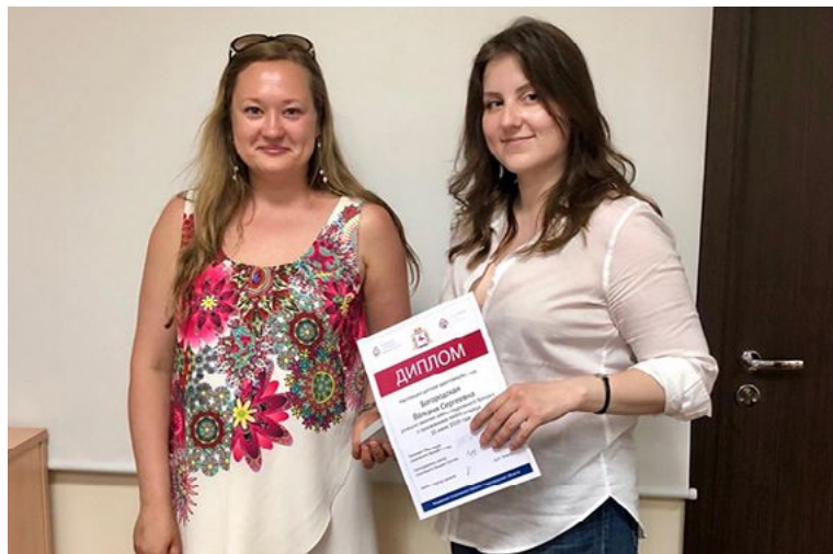
Первый выпуск школы «Спутник» в Нижнем Новгороде