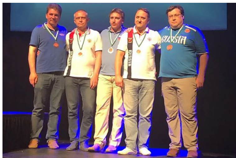
Бронза в Остенде 2018