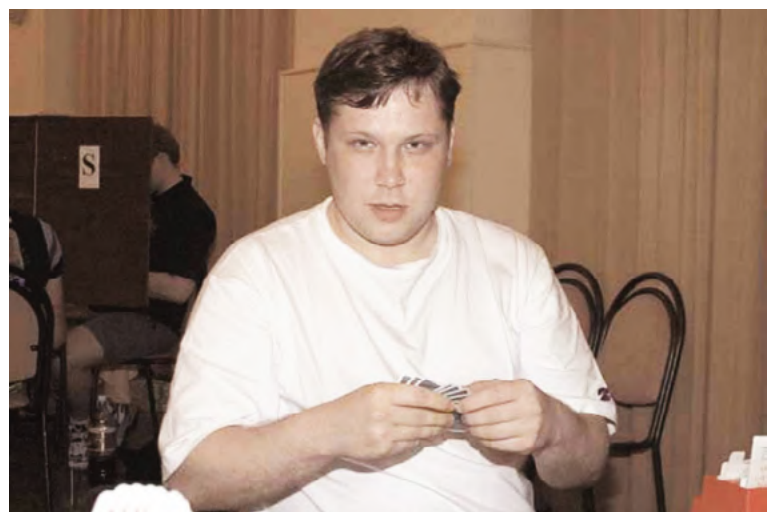
На юниорском чемпионате Европы 2004 года